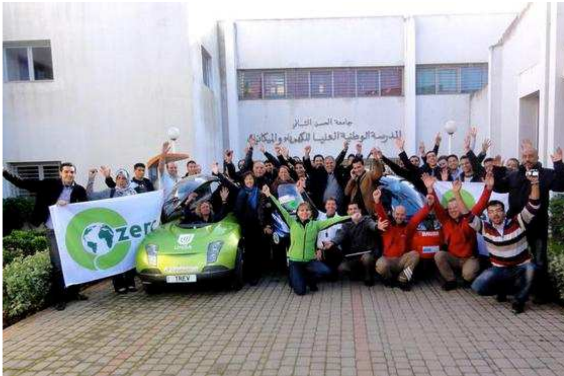
Vorfriede vor dem Start zur Schlussetappe Casablanca - Schweiz.

Seit 71 Tagen läuft das Zero Race des Luzerner Solarpioniers Louis Palmer. Nun sind die Teams zur letzten Etappe gestartet. Am 25. Februar erreichen sie Root.